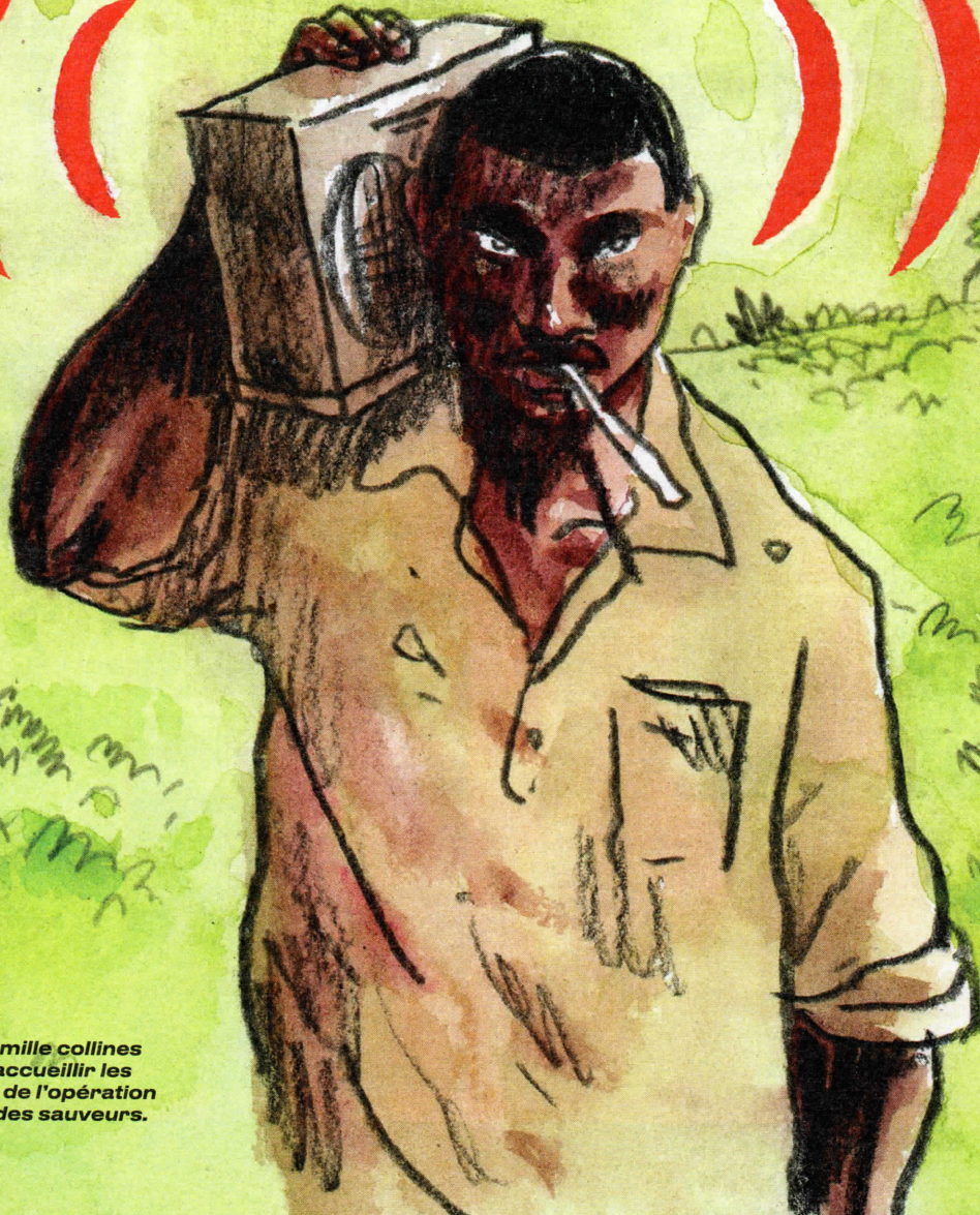
En juin 1994, Radio mille collines exhorte les Hutu à accueillir les troupes françaises de l'opération Turquoise comme des sauveurs.