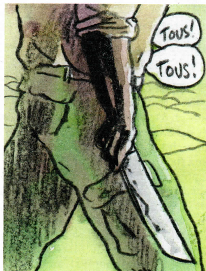
Des milices armées de machettes ont pétré de nombreux assassinats.

Le faire-part de naissance de Radio mille collines date du 8 avril 1993. Ce jour-là, un an avant le début des massacres, un notaire de Kigali, la capitale rwandaise, enregistre son acte de création sous le numéro K0115325. Il est signé par 50 actionnaires, pour la plupart des extrémistes qui noyaient la présidence du pays. Son représentant officiel s'appelle Félicien Kabuga. Riche homme d'affaires, c'est un parent par alliance du chef de l'Etat, Juvénal