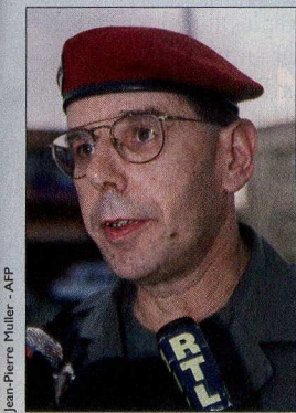
Jean-Pierre Muller - AFP