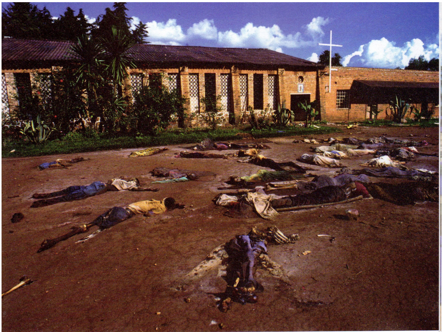
Mai 1994 : victimes tutsi près de l'église de Rukara, où plusieurs centaines de personnes ont été tuées.

des milices, manipulés par certains médias extrémistes qui appellent chaque citoyen hutu à se mobiliser contre l'ennemi tutsi, nombreux sont les civils hutu à participer au génocide. Les liens de proximité entre voisins et les liens familiaux facilitent la traque et l'identification des Tutsi, à tel point que l'historienne Hélène Dumas évoque le rôle crucial du « retournement meurtrier du voisinage » ( Le génocide au village , Seuil, 2014).