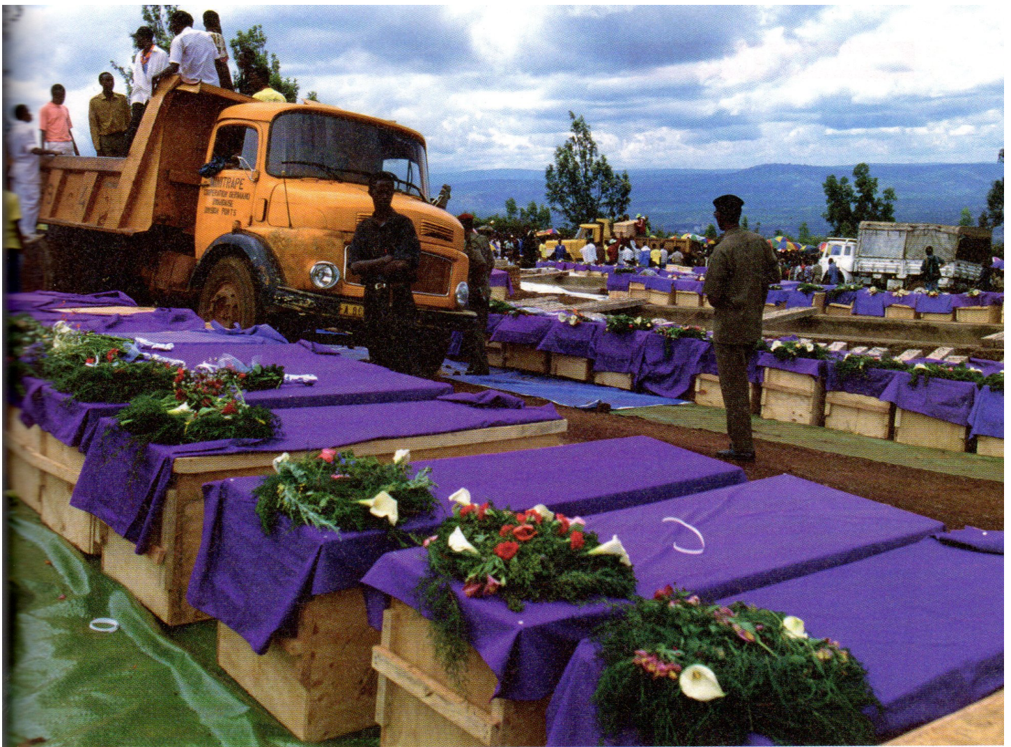
Un an après le génocide des Tutsi : un pays entre douleur, commémoration et espoir de réconciliation.

Du 15 avril au 15 juin, la stratégie française revêt plusieurs dimensions. À l'ONU, la France affirme rester à la disposition des Nations unies où elle soutient la résolution 912 de réduction des effectifs de la Minuar (de 2 539 à 270 hommes). Elle renvoie dos à dos le FPR et le gouvernement intérimaire. Elle refuse de recourir au terme génocide qui s'impose pourtant dans la presse durant la deuxième quinzaine du mois de mai. Le 27 avril 1994, Jérôme Bica-mumpaka, ministre des Affaires étrangères du GIR (Gouvernement intérimaire rwandais), et Jean-Bosco Barayagwiza, responsable de la CDR (Coalition pour la défense de la République), sont reçus à l'Élysée et à Matignon alors même que les massacres se déroulent sous leur responsabilité, comme le rappelle le rapport de la mission d'information parlementaire.