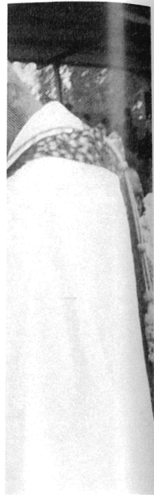
du MDR-Power. ant le génocide.