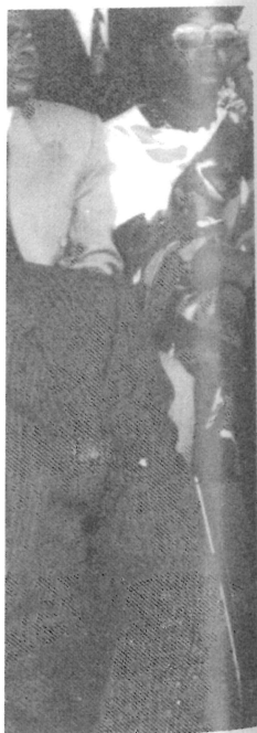
t-major des FAR, l. 1993).