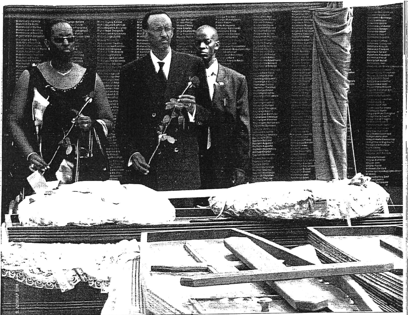
Le président Paul Kagamé et son épouse Janet au Mémorial de Gisozi, le 7 avril 2004, dixième anniversaire du génocide.