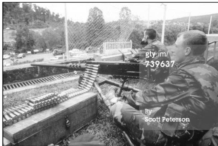
Figure 7 : « United Nations soldiers maintain security during evacuations April 13, 1994 in Kigali, Rwanda. Following the apparent assassination of Rwandan President Juvenal Habyarimana, a massive wave of Hutu-inflicted revenge killings has rocked the African nation, leaving thousands of Tutsi civilians dead

Il semble que la photographie des militaires belges de Scott Peterson soit aussi prise depuis la terrasse de l'École française mais elle est datée du 13 avril et les soldats sont des Belges reconnaissables à leur tenue camouflée (fig. 7). Il croit que ce sont des Belges de la MINUAR. Erreur, ce sont des Belges de l'opération « Silver back ». Ils disposent d'une mitrailleuse type Browning M2 de FN Herstal.