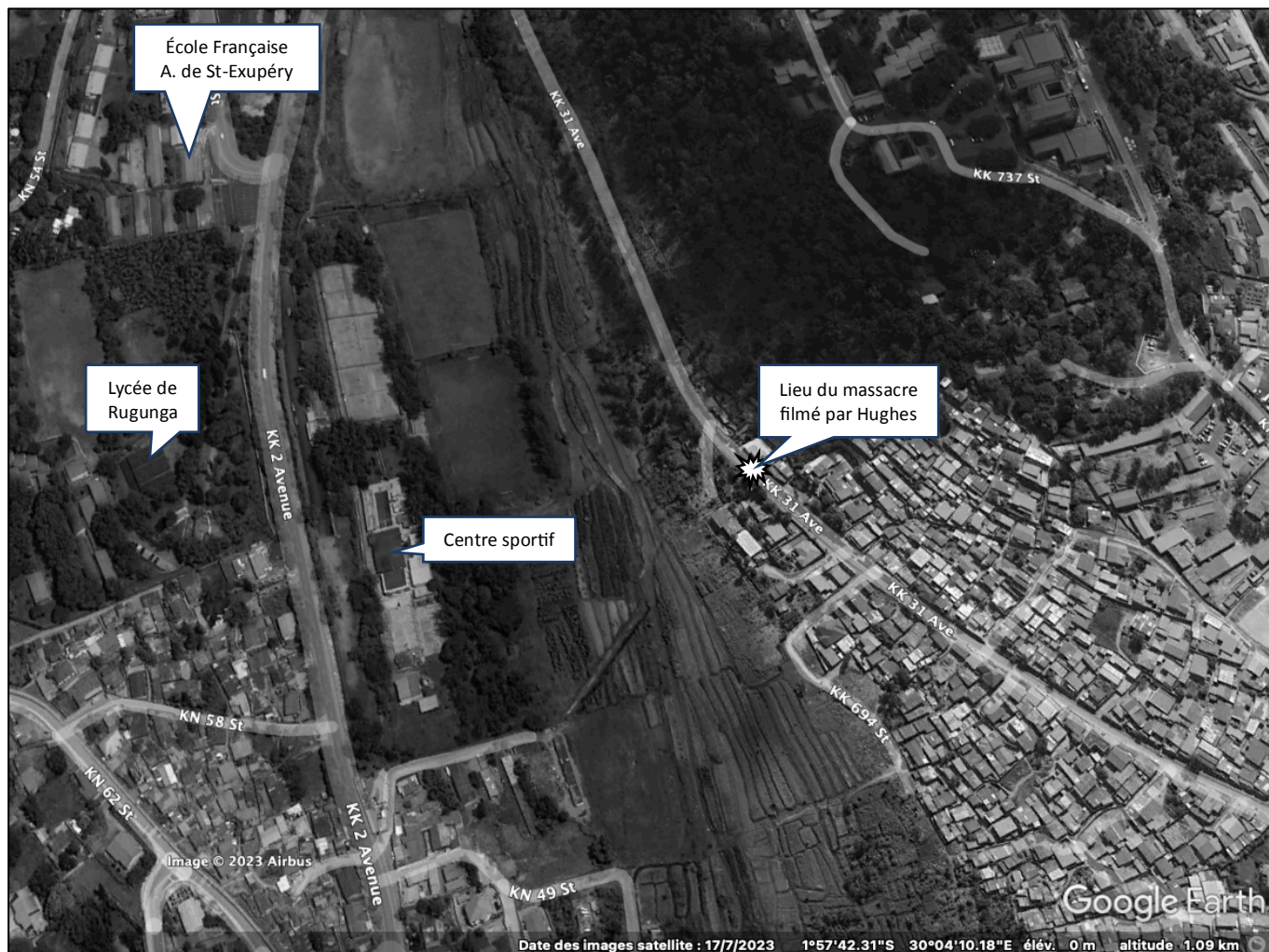
Figure 3 : Localisation de la scène du massacre filmé par Nick Hughes sur la vue satellite de Kigali de 2023. (Source : Google Earth Pro 2023 ; DAO : M. Morel 2023).

À l'aide de Google Earth Pro , nous mesurons environ 430 mètres entre l'École française (à côté de la route en « épingle à cheveux ») et les maisons le long du chemin qui monte à Gikondo. Le lycée de Rugunga est à côté de l'École française.