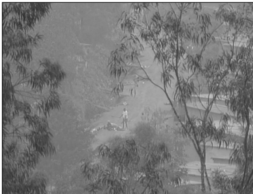
Figure 1 : Image extraite de la scène filmée par Nick Hughes reprise dans « The Dead are Alive » en 1996.