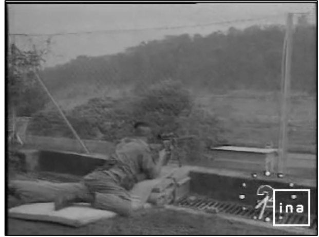
Figure 6 : « Journal de 7h30 », France 2 , 12 avril 1994.

Il semble que la photographie des militaires belges de Scott Peterson soit aussi prise depuis la terrasse de l'École française mais elle est datée du 13 avril et les soldats sont des Belges reconnaissables à leur tenue camouflée (fig. 7). Il croit que ce sont des Belges de la MINUAR. Erreur, ce sont des Belges de l'opération « Silver back ». Ils disposent d'une mitrailleuse type Browning M2 de FN Herstal.