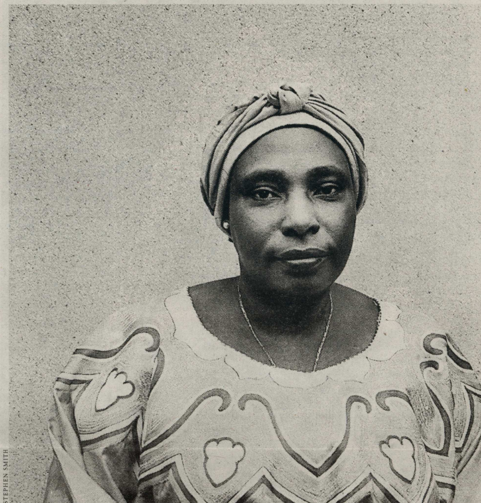
Agathe Habyarimana, le 6 avril 1994, a assisté à l'explosion de l'avion dans laquelle a péri son mari.

de leur indépendance d'esprit en démêlant les fils de l'écheveau rwandais. Ils seront jugés par rapport à leur capacité à répondre à des interrogations qui, cinq ans après le génocide au Rwanda, ont provoqué un vaste mouvement d'opinion, des états d'âme sans précédent depuis la guerre d'Algérie. Jusqu'où est allé le soutien à l'ancien régime de Kigali, la compromission avec les têtes pensantes et les bras armés d'un crime contre l'humanité ? Responsabilité. Y a-t-il eu une politique officielle ou des « réseaux » ont-ils tissé la trame d'une diplomatie parallèle ? Dans ce contexte, le nom du capitaine Paul Barril, ex-gendarme du GIGN, a été souvent cité. Enfin, l'armée française est-elle allée au-delà des instructions politiques en s'engageant directement dans les combats ou, pire encore, en instruisant des miliciens hutus ? Pris au piège de la substitution, des soldats français ont-ils procédé à des interrogatoires de prisonniers de guerre, à des contrôles d'identité dans un pays où l'appartenance ethnique devait s'afficher ? Une attention particulière se portera sur les livraisons d'armes françaises après l'imposition d'un embargo par les Nations unies, le 8 avril 1994. Etienne de l'Épée