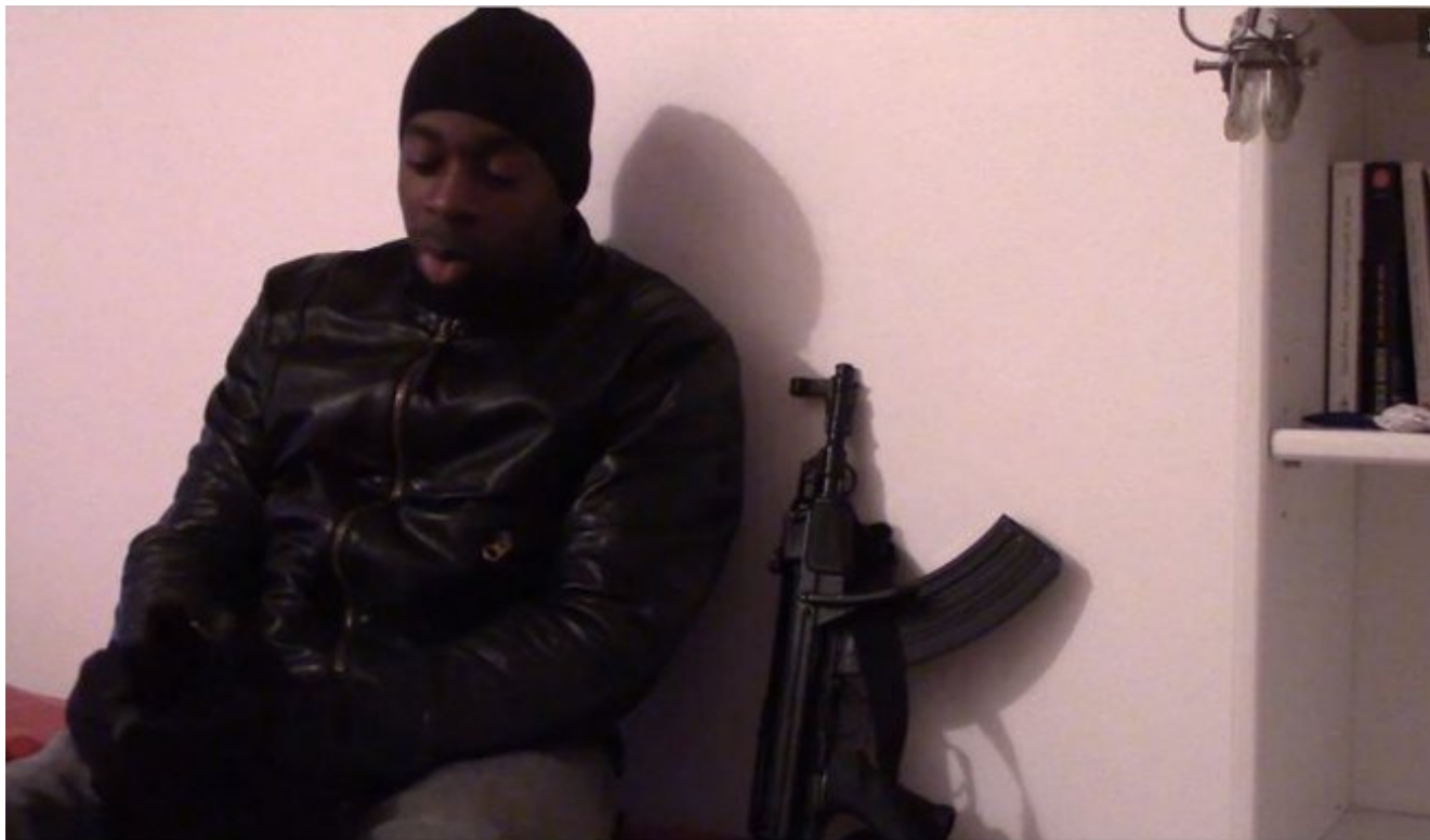
Amedy Coulibaly, et l'une de ses armes, dans une vidéo tournée juste avant la prise d'otages.

Dans leur ordonnance finale, les juges antiterroristes décident pourtant de sortir l'indicateur du dossier, au motif que « les seules déclarations » de deux mis en cause « ne permettent pas d'envisager sa participation à l'association de malfaiteurs en vue de préparer des actes de terrorisme d'atteintes aux personnes », « aucun contact n'étant démontré entre lui et Amedy Coulibaly ou des proches de ce dernier ».