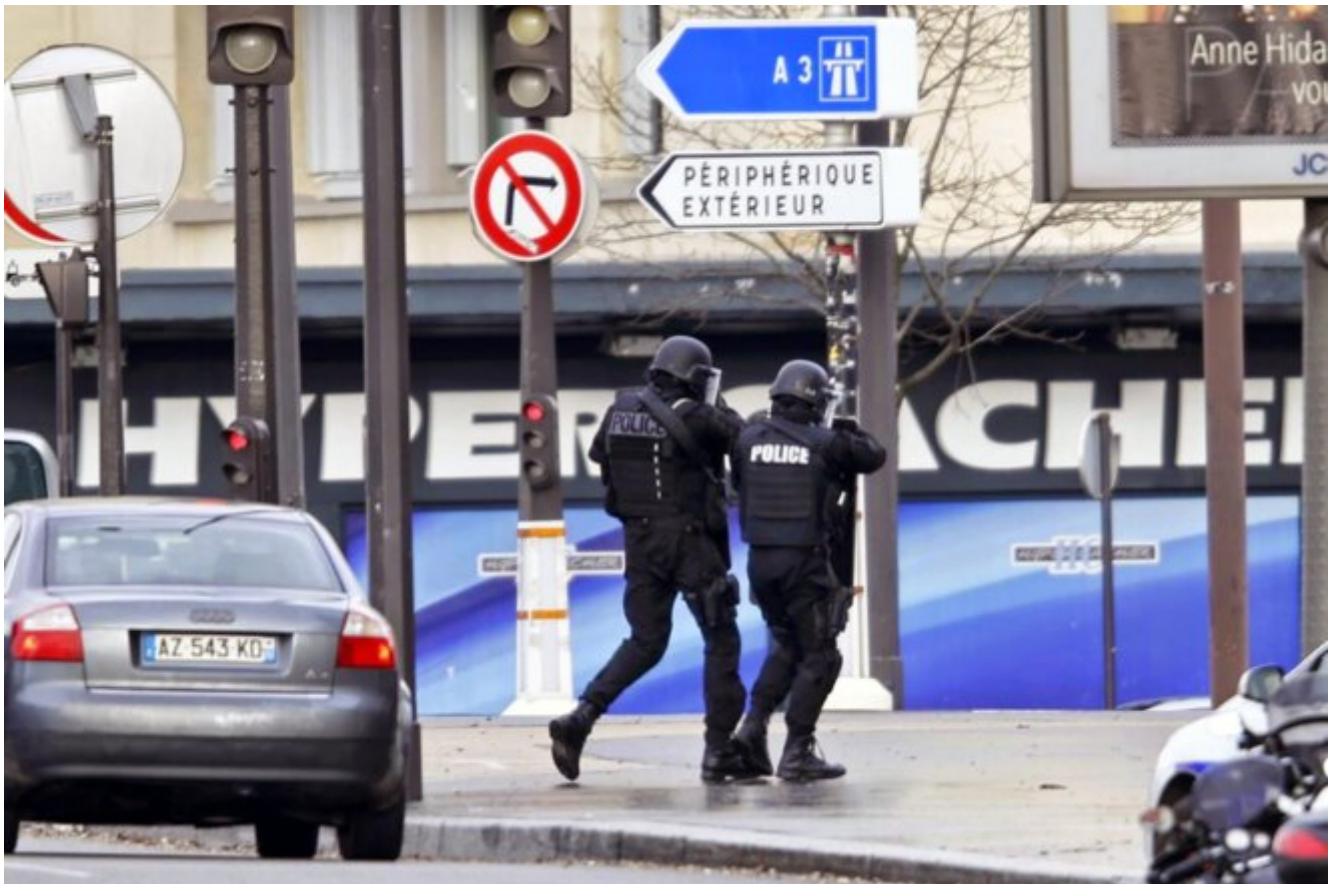
Les forces de l'ordre se préparent à l'assaut lors de l'attaque du magasin Hyper Cacher par Amedy Coulibaly