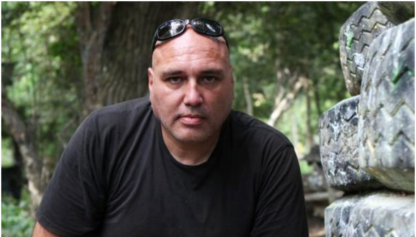
Claude Hermant.

Si tous ignoraient la finalité des ventes qu'ils opéraient, Dubroeuq, dit « Monstro », a fait des déclarations troublantes lors de son interpellation par la police tchèque, le 17 avril 2015, à la frontière slovaque. Alors que des armes – des fusils-mitrailleurs Uzi et Scorpion VZ 61 – sont trouvées dans le coffre de sa voiture, Dubroeuq prétend qu'il a été « infiltré dans un groupe d'extrémistes ». Il parle de « 300 000 euros d'armes » démilitarisées achetées à un magasin slovaque, où il vient justement de se procurer des armes. « Je sais que le groupe qui a acheté ces armes les a débloquées et revendues par la suite aux islamistes », déclare-t-il.