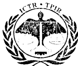
[Sceau du Tribunal]

Fait à Arusha (Tanzanie), le 9 octobre 2012