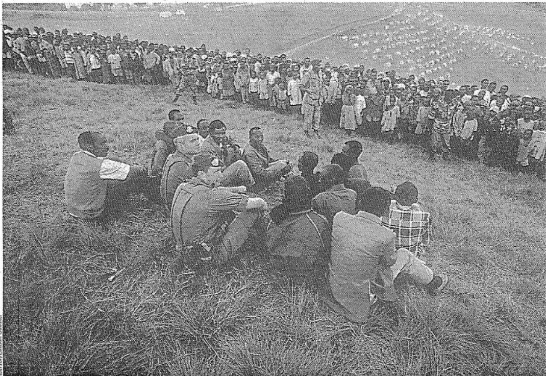
Le contingent français, vendredi, a pris position près du camp de Nyarushishi, qui accueille 8 000 réfugiés tutsis.

« Notre principal souci est de dissuader les fauteurs de trouble. Il est exclu d'aller faire la guerre. Notre mission est de protéger les populations », assure ce dernier. « Nous recensons les camps de réfugiés et participons à la coordination de l'aide humanitaire. Il n'est pas question de prendre parti pour un camp ou l'autre », affirme-t-il. Samedi, lors de leur première reconnaissance dans la région de Gisenyi, fief du président Juvénal Habyarimana (assassiné le 6 avril dernier), les milices hutus progouvernementales auraient d'ailleurs fait quelques difficultés à la progression des détachements français. Ce qui a amené un responsable de l'état-major à Paris à faire état de « tensions ». Celles-ci ne semblent toutefois pas avoir été perçues avec la même acuité sur le terrain. Rendant compte de