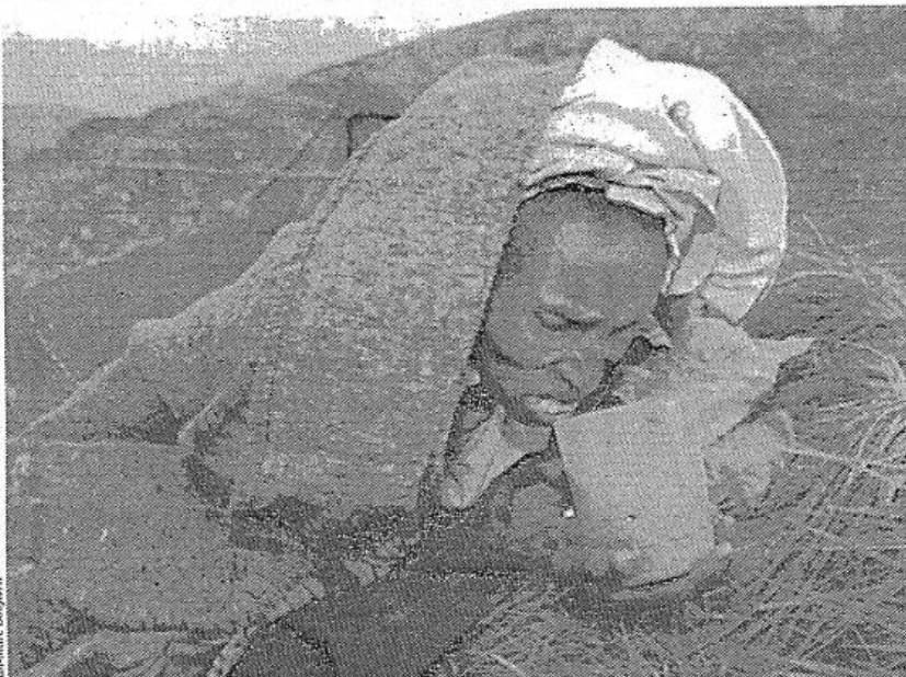
A Nyarushishi, samedi. Une femme tutsi, malade, se soigne avec du maïs dilué dans l'eau.