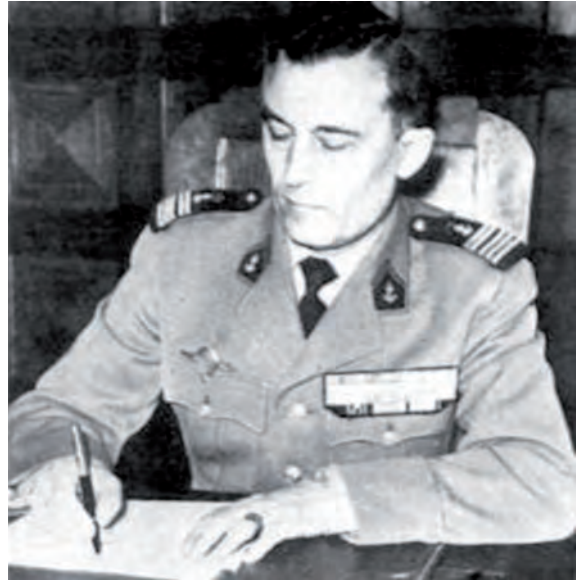
Le colonel Trinquier.

En 1961, trois ans avant la sortie du livre de Galula aux États-Unis, le colonel Roger Trinquier publie La guerre moderne 11 . C'est un ouvrage majeur, écrit par une figure des unités aéroportées. Né en 1908 et mort en 2000, issu de l'école de l'infanterie de Saint-Maixent, ce vétéran de la Seconde Guerre mondiale, de la guerre d'Indochine et d'Algérie est aussi un familier de la Chine et de la Corée. « Praticien quasi instinctif de l'irrégularité, doublé cependant d'un organisateur méthodique », Trinquier livre une « méthode, des procédés et une stratégie complète de la guerre irrégulière », estime l'universitaire François Géré. La stratégie de Trinquier repose sur les quatre facteurs structurants que sont la nature de l'action (offensive/défensive), la population (centre de gravité), le territoire (ami/ennemi) et le temps (urgence/longue durée). Marqué par les progrès du communisme dans l'immédiat après Seconde Guerre mondiale, Trinquier conçoit l'insurrection ou l'action subversive comme un phénomène essentiellement exogène 12 . Présupposant que les territoires