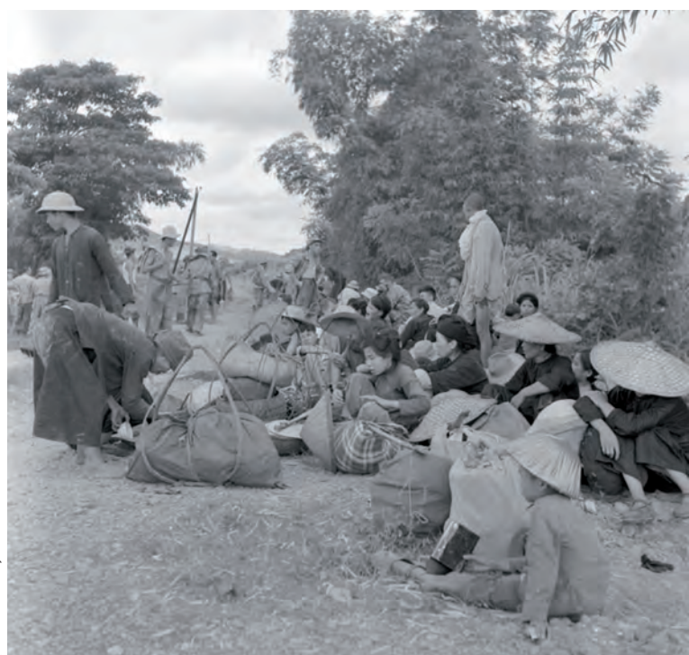
A la fin de l'opération Hirondelle, la population fuit la zone vietminh sous la protection des troupes.