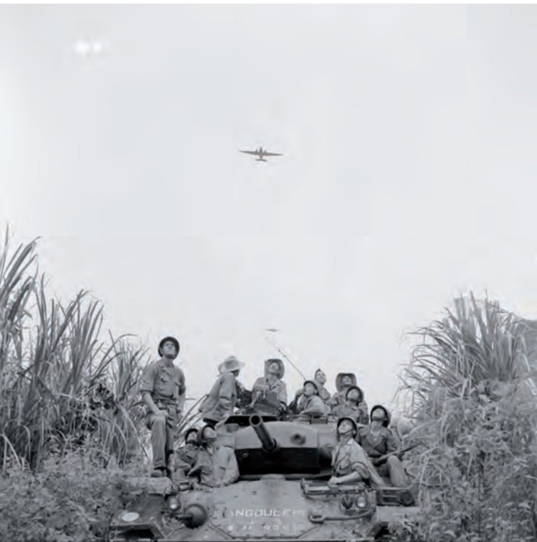
S'affranchir des axes...

ment, être consacrés à l'instruction : sa discipline de feu, ses aptitudes manœuvrières, l'efficacité de son tir sont jugés supérieurs à celles d'autres unités, formées de « vieux » soldats comptant déjà de plus longs états de service. Dans ce contexte, les unités régulières du Viêt-minh, qui passent jusqu'à huit mois sur douze à l'instruction dans ses zones de repli de la rébellion, surclassent en général l'infanterie métropolitaine ou autochtone, surtout dans le combat de nuit, que les Français subissent quand il leur est imposé mais qu'ils ne recherchent guère parce qu'ils ne l'ont pas étudié. « Usure de l'infanterie et manque d'instruction expliquent que nous ne puissions nous passer de la sacro-sainte "combinaison des armes", que nos unités se sentent peu sûres d'elles et aient un rendement médiocre en terrain difficile ».