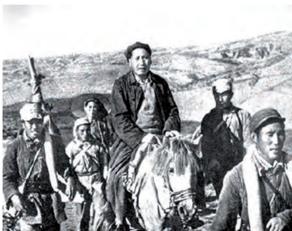
Mao pendant la « Longue marche ».

On comprend dès lors qu'un fils dénonce son père coupable d'avoir murmuré contre le parti, renseigné une patrouille ennemie ou simplement tué une poule dans le village pour améliorer l'alimentation familiale. S'il s'abstenait de le faire, il deviendrait complice et serait lui-même inévitablement dénoncé. La redoutable perversion de ce système, où la délation est érigée en « devoir civique » (ou social), est que le plus grand nombre en vient à considérer qu'il vaut mieux dénoncer le père plutôt que de perdre toute la famille. Chacun étant toujours susceptible d'espionner et d'être espionné, toute cellule organique est rapidement détruite et l'individu est livré sans « défenses naturelles » au pouvoir central.