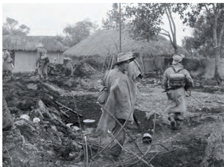
Patrouille dans un village.

Pour faire échec à la guerre révolutionnaire du Vietminh, Hogard considère que l'armée française est dans l'obligation de pacifier les zones occupées. Cela signifie être capable de mener trois tâches différentes mais complémentaires et en partie redondantes : le contrôle en surface, le contrôle des axes et la pacification proprement dite.