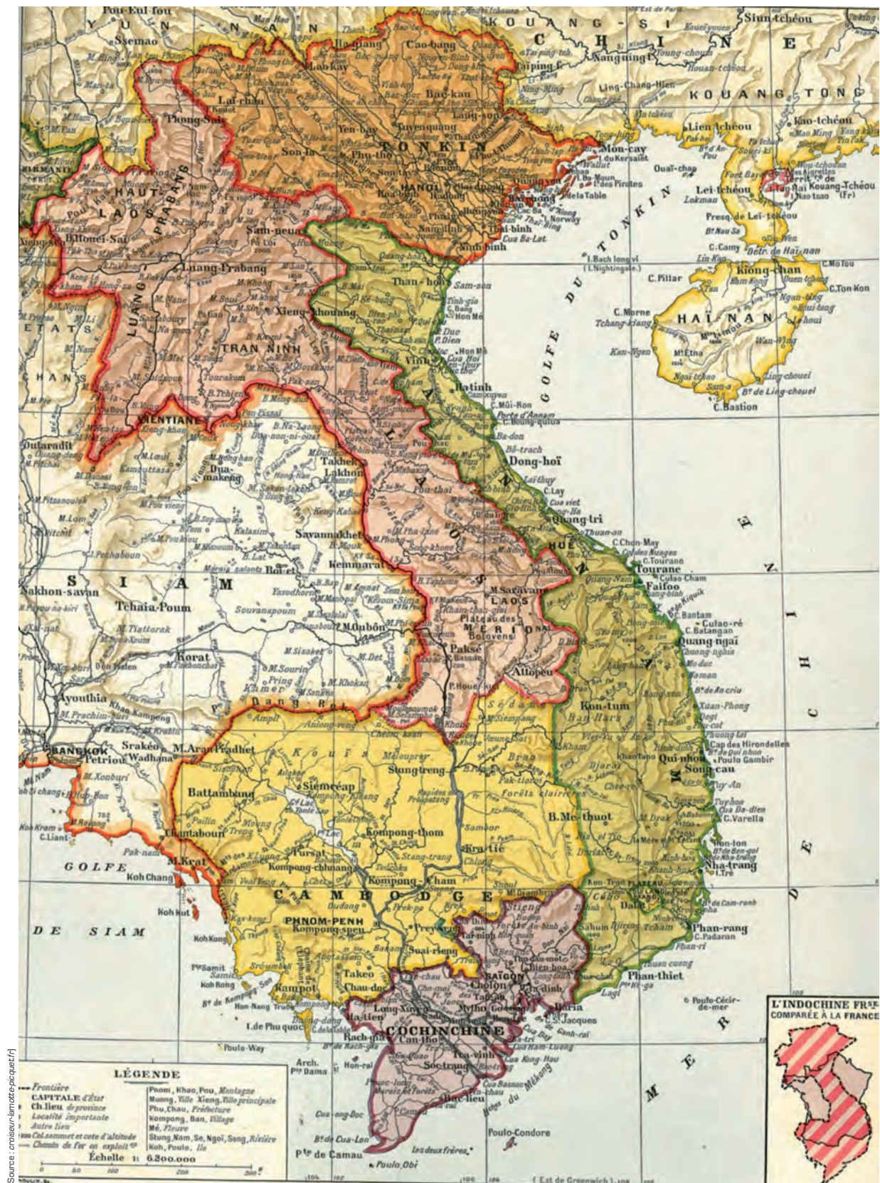
La fédération indochinoise (Cochinchine, Annam, Tonkin, Laos, Cambodge).