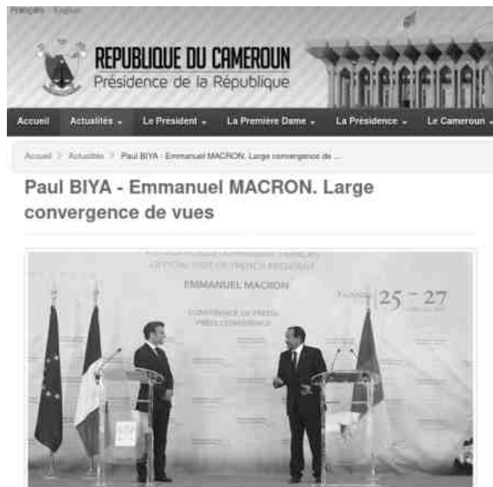
Capture d'écran du site officiel de la présidence camerounaise

sion des quarante ans de pouvoir de son père, s'est offert plusieurs bains de foule dans des localités du nord du Cameroun. Un fait assez rare, qu'il faut noter, c'est qu'il portait des vêtements à l'effigie du parti au pouvoir, le RDPC, signe d'une certaine politisation de son image publique. Tous ces faits font redouter au Cameroun ce que d'autres ont appelé une « succession de gré à gré » à la tête du Cameroun.