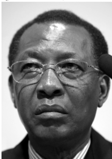
Idriss Déby lors du 6ème forum mondial de l'eau.

corruption, de la violence et de la pauvreté. Dans ce contexte préélectoral, la réponse du régime aux mobilisations et revendications a été la violence : tirs à balles réelles contre manifestants, intimidations, arrestations des tête de file des différents mouvements de société civile constitués au cours des derniers mois qui appelaient à différentes formes de protestation pacifique contre le régime en février dernier.