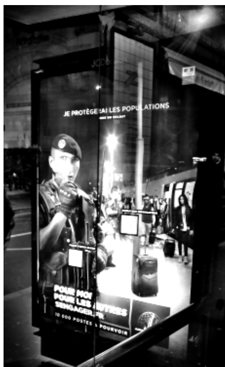
« Je protégerai les populations ». Campagne de recrutement de l'armée française