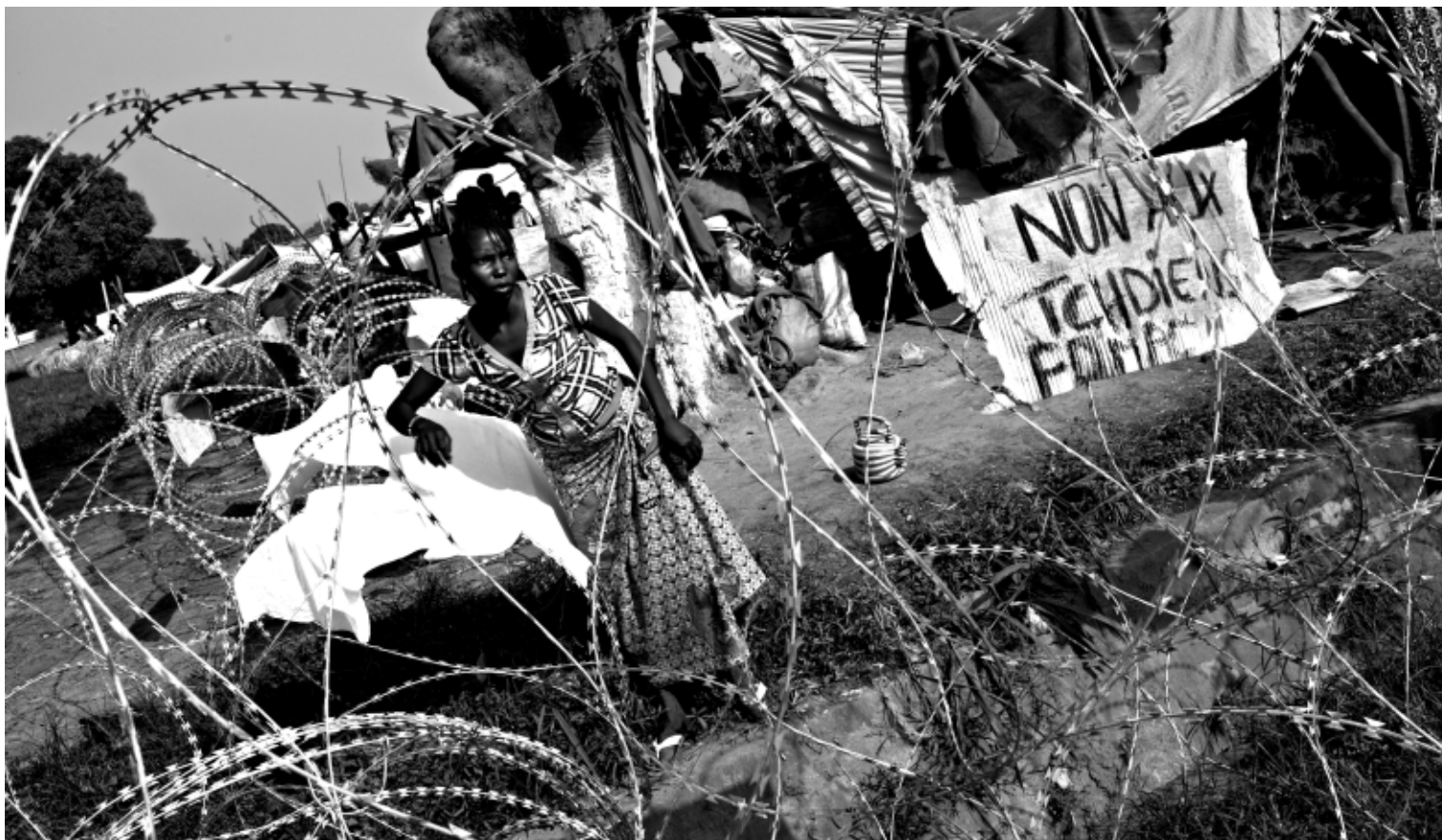
Affichette hostile aux soldats tchadiens au camp de l'aéroport de Bangui.

explosive. La première action de ce corps expéditionnaire français est de désarmer et de cantonner les membres de la Séléka. Ce faisant, il va donner un net avantage aux milices anti-balaka, qui vont d'autant plus s'en prendre à la communauté musulmane, assimilée à la Séléka. Donc, bien loin de diminuer, le niveau de violence va sensiblement augmenter à la suite du déploiement français. Et ce qui était prévu pour être une opération de courte durée va se transformer en un bourbier.