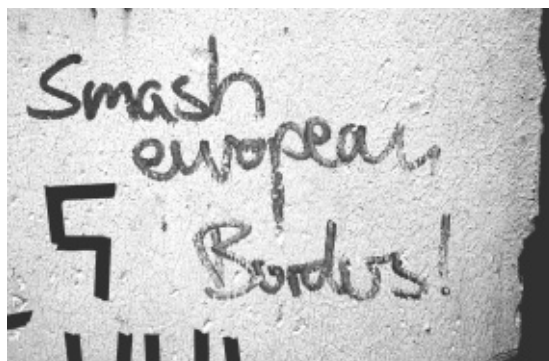
Sur un fragment du mur de Berlin.

Si la Turquie a accepté de devenir la sous-traitante de l'UE tant pour les contrôles aux frontières que pour l'application du droit d'asile (sic), c'est que le marchandage en valait la peine : elle a obtenu la reprise des négociations pour son entrée dans l'UE, la promesse