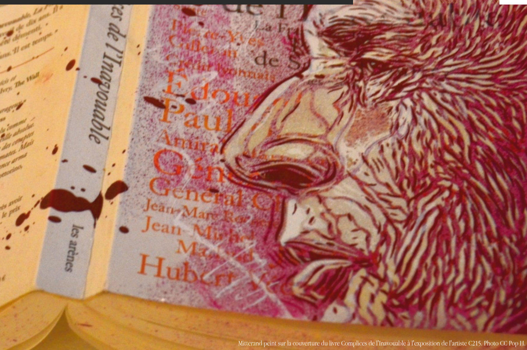
Mitterrand peint sur la couverture du livre Complices de l'Inavouable à l'exposition de l'artiste C215.

MENSUEL D'INFORMATION SUR LA FRANÇAFRIQUE ÉDITÉ PAR L'ASSOCIATION SURVIE