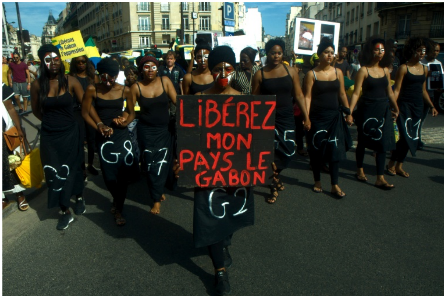
Groupe de femmes lors de la manifestation du 10/09/2016 à Paris contre le "coup d'état électoral" au Gabon.

L'opposition tient bon : la « journée de deuil » du 6 octobre, pour laquelle la population privée du droit de manifester était invitée à exprimer son rejet du régime en refusant d'aller travailler, a été bien suivie. Deux jours après, l'appel au boycott visait le match des « Panthères », l'équipe nationale de foot, car les joueurs n'ont pas pris position contre la répression.