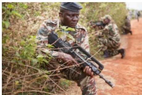
Soldats camerounais à l'entraînement équipés de FAMAS, mars 2014

T out se périmé, même les armes. Après des décennies de bons et loyaux services, l'armée française a décidé de se séparer du FAMAS, le « Fusil d'Assaut de la Manufacture d'Armes de Saint-Étienne » dont sont dotées traditionnellement ses troupes. C'est le HK 416 de l'entreprise allemande Heckler & Koch qui a été choisi pour le remplacer, suscitant une polémique souverainiste, certains demandant à ce que les soldats français puissent continuer à tuer avec des armes françaises. En réalité, l'enjeu est ailleurs. Car ce renouvellement d'armement n'est pas un cas isolé. Ainsi, le magazine RAIDS (septembre 2016) relate comment, en sus du fusil d'assaut, l'armée de terre va aussi changer ses pistolets semi-automatiques tout comme le fusil de ses tireurs de précision. Seront de la même façon remplacés les lance-roquettes AT4CS, Eryx, Milan et Javelin. Ce