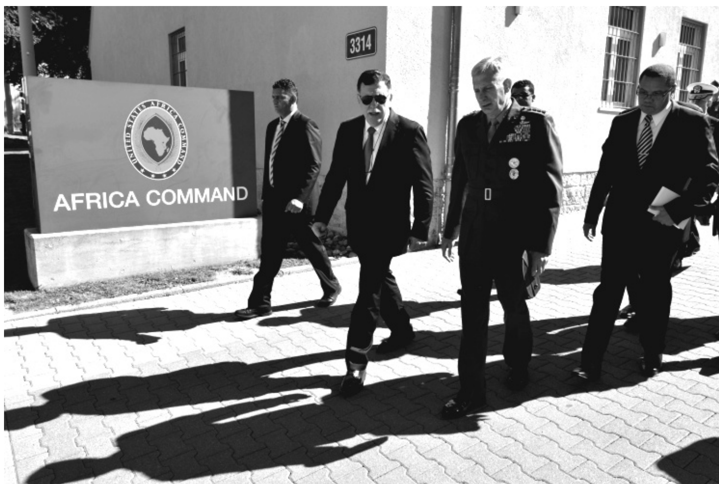
Le premier ministre du gouvernement d'Union nationale, Faïez Sarraj avec le général Waldhauser, lors d'une visite au centre de commandement d'AFRICOM à Stuttgart en juillet 2016.