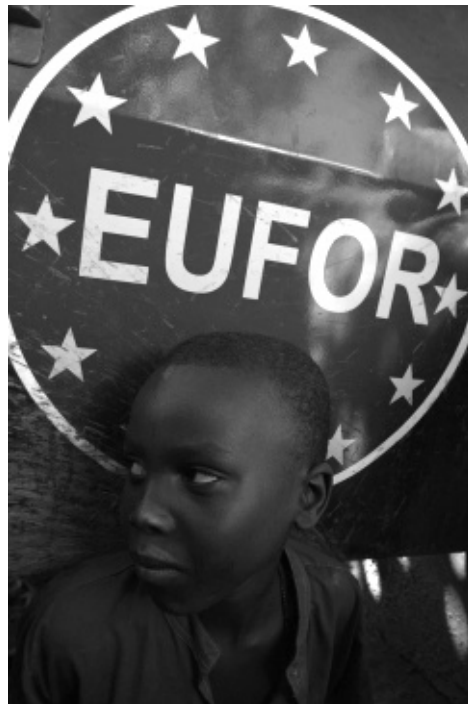
Un enfant devant un blindé de l'EUFOR en RCA.

logés sur la base UCATEX. L'enfant rapporte aussi les cas détaillés de deux abus sexuels sur des amis à lui par d'autres militaires français (« Nico » et « Jean ») eux aussi basés à l'ex-usine UCATEX et affectés à la sécurité de l'aéroport (respectivement « Nico », au check point piéton de l'aéroport fin mars, et « Jean », au niveau de la tour de contrôle mais sans précision de date).