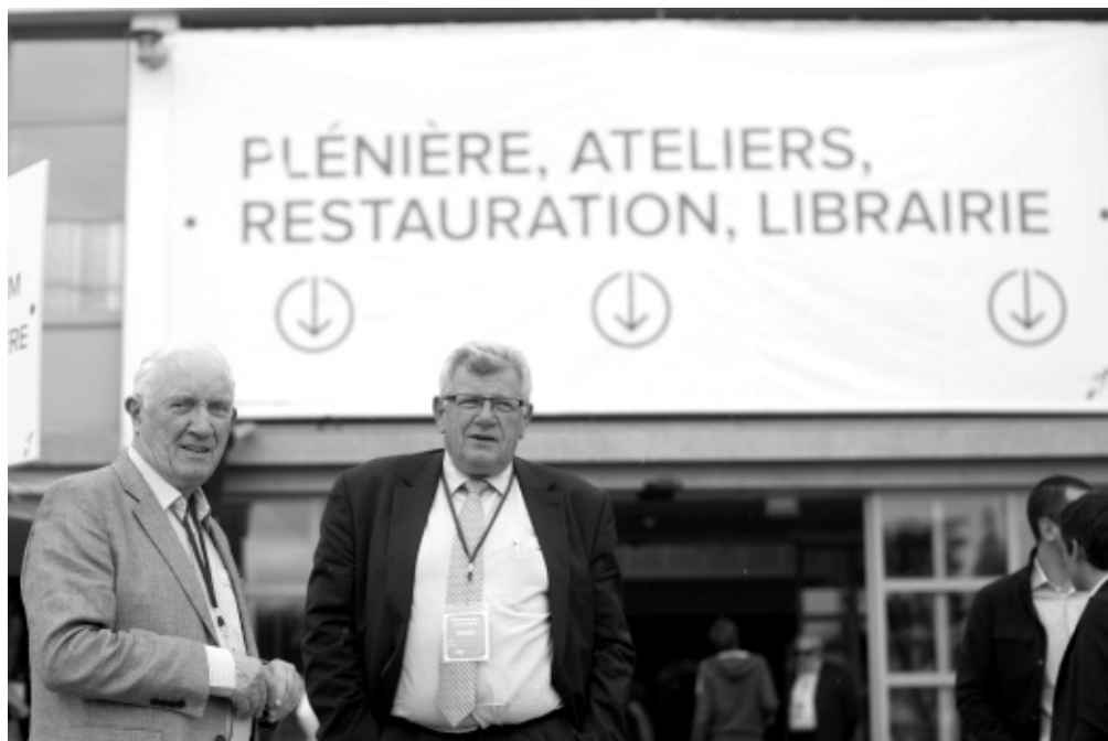
Christian Eckert (au centre) à l'université d'été 2015 du PS. Alors que comme député, il proposait il y a quelques années des amendements en faveur de la lutte contre l'évasion fiscale, le désormais Secrétaire d'Etat au budget Christian Eckert défend désormais au nom du Gouvernement des mesures contre la transparence.

Dans la nuit de mardi 15 au mercredi 16 décembre, le gouvernement a finalement décidé de s'opposer frontalement à un amendement déjà voté à l'Assemblée 10 jours auparavant, ensuite supprimé par le Sénat (majoritairement de droite), et réintroduit lors du nouvel examen du PLFR 2015. Le masque d'un gouvernement français qui se dit en pointe dans la lutte contre l'évasion fiscale est tombé : la manœuvre orchestrée par le Secrétaire d'État au budget, Christian Eckert, a été ensuite largement commentée dans les médias, bien davantage que les précédents coups bas portés à la lutte contre l'évasion fiscale 3 .