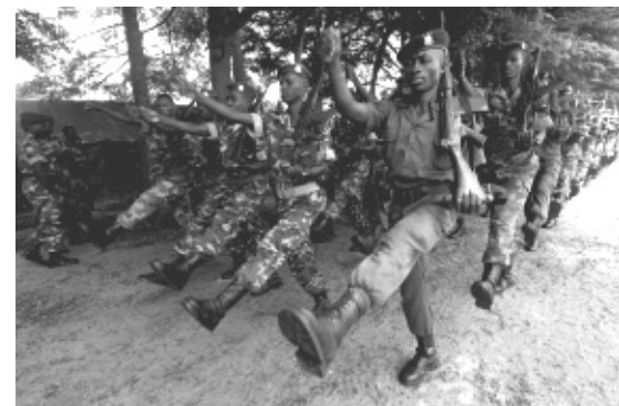
Militaires burundais en manoeuvre.

Il reste possible d'empêcher le président Nkurunziza de consolider son pouvoir par des massacres encore plus massifs que précédemment, et qui pourraient dégénérer en génocide. Si la communauté internationale veut vraiment l'empêcher au Burundi, à la