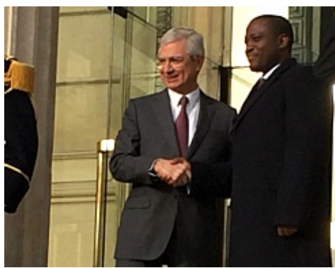
Guillaume Soro reçu par Claude Bartolone devant l'Assemblée Nationale le 5/12/2015.

A ncien syndicaliste étudiant, Guillaume Soro a été de 2002 à 2011 le leader de la rébellion armée contre le président d'alors, Laurent Gbagbo, à qui il sera imposé à partir de 2007 comme Premier ministre d'un gouvernement de « réconciliation ». En avril 2011, à l'issue d'une parodie d'élection présidentielle opposant son mentor Alassane Ouattara au sortant Gbagbo et de la crise militaire qui s'ensuit, l'armée française et les rebelles arrêtent Gbagbo, son fils Michel et sa femme Simone, et installent Ouattara au pouvoir. Un an plus tard, Guillaume Soro quitte la primature pour la présidence de l'Assemblée nationale, qu'il occupe toujours.