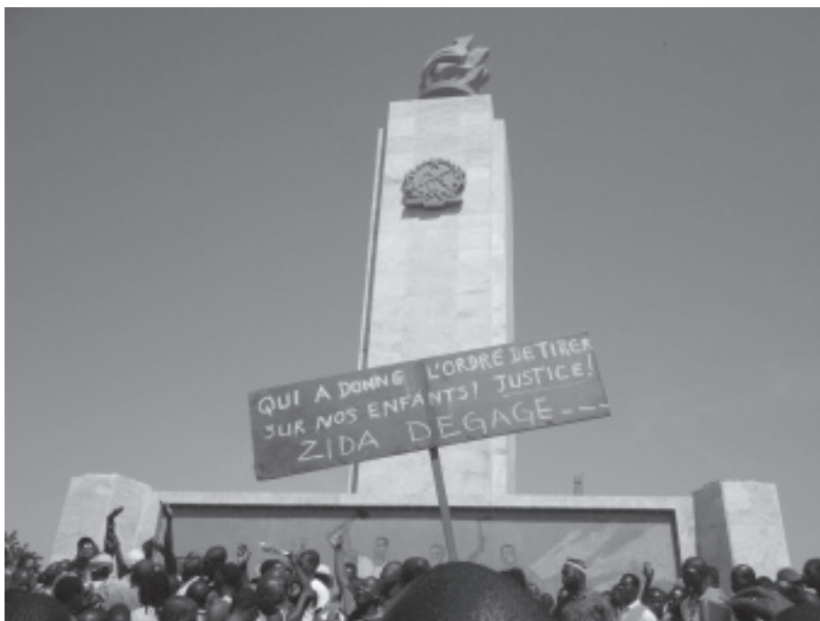
La défiance vis-à-vis du lieutenant-colonel Zida s'affichait sur de nombreuses pancartes, dans les manifestations du 2 novembre à Ouagadougou.