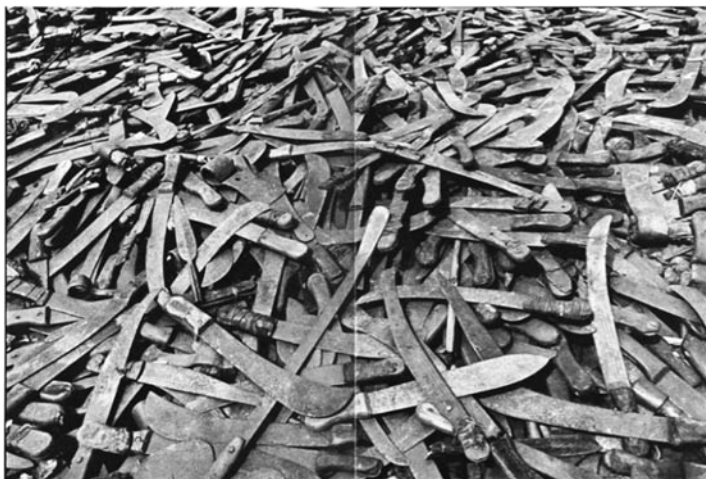
L'amoncellement de machettes importées par milliers avant le génocide.