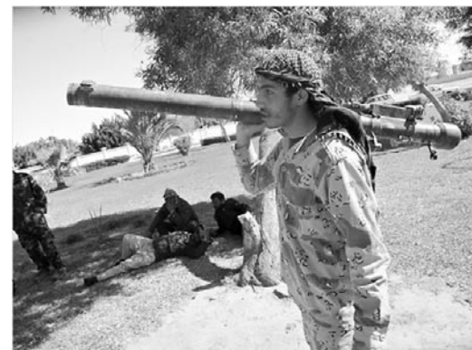
Un combattant libyen équipé d'un missile SA-7

L'affaire des SAM-7 préoccupait également les services de sécurité de la région mais aussi les services français dont « les pires craintes » étaient confirmées d'après plusieurs articles parus cette année-là dont ceux du Canard Enchaîné (Intox aux missiles, Billets d'Afrique n°204, juillet août 2011). Dans une dépêche AFP du 22 juin 2011, l'expert algérien Mohamed Mokeddem, auteur notamment de « La France et l'islamisme armé » commentait l'interception, le 12 avril, dans le désert nigérien, de trafiquants d'armes transportant 640 kg d'explosifs, du Semtex tchèque : « Cela confirme que le rôle des islamistes radicaux »