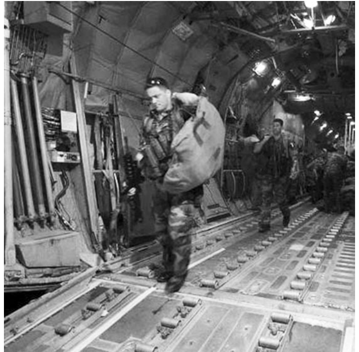
Des renforts français débarquent à Bangui le 22 mars en provenance de Libreville au Gabon.

pour contrer le coup de force de Bozizé. Ce dernier, qui est abandonné l u i - m ê m e aujourd'hui n'est donc pas une exception mais seulement le dernier en date du lâchage de la France, pour des raisons qui n'ont rien à voir avec le respect de la s o u v e r a i n e t é du pays, simplement parce que, comme nombre d'autres, sa tête ne revient plus à ses protecteurs. La France est si peu soucieuse de la souveraineté de la Centrafrique qu'elle a envoyé six cents soldats occuper l'aéroport de Bangui pour « protéger les ressortissants et les intérêts français », ce qu'elle n'oserait jamais faire en Ukraine ou en Argentine, quels que soient les risques courus par ses ressortissants et ses intérêts lors de troubles civils. Il y a donc bien