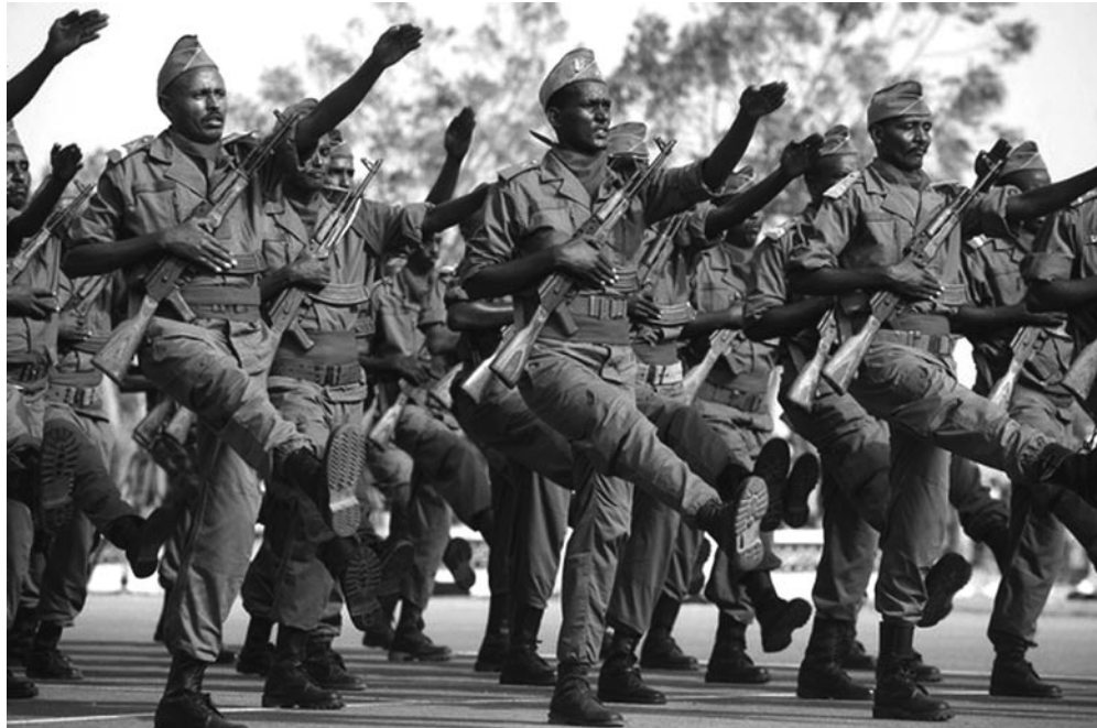
Plusieurs officiers de l'Armée nationale djiboutienne, écrivant sous le sceau de l'anonymat, affirment leur intention de protéger la population et de soutenir ses revendications légitimes.

Djibouti est souvent cité comme le pays d'Afrique qui reçoit directement et indirectement l'aide par tête d'habitant la plus élevée (Union européenne, FMI, Banque mondiale, USAID, fonds arabes). A cela il faut ajouter les 30 millions d'euros annuels versés par la France au titre du loyer pour sa