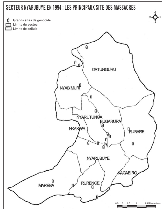
Carte réalisée par Vital Nzabanita, extraite de Privat Rutayizwa et Paul Rutayisire, Génocide à Nyarubuye : monographie sur l'un des principaux sites du génocide des Tutsi de 1994 au Rwanda , Kigali, Editions rwandaises, 2007.

À Nyarubuye, comme dans le reste du pays, les massacres ont été préparés graduellement. L'absence de « tournant décisif » conduit à un débat sur le moment de rupture. Ces