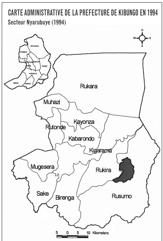
Carte réalisée par Vital Nzabanita, extraite de Privat Rutazibwa et Paul Rutayisire, Génocide à Nyarubuye : monographie sur l'un des principaux sites du génocide des Tutsi de 1994 au Rwanda , Kigali, Éditions rwandaises, 2007.

« Vers 1976, les Bakiga [termes désignant des Hutu issus des préfectures du Nord-Ouest] ont commencé à s'établir sur les bords de l'Akagera. Ils ont défriché les forêts, cultivé le sorgho, etc. Nos vaches s'abreuvaient d'eau salée appelée amakera près de l'Akagera dans des abreuvoirs aménagés. Quand les Bakiga sont arrivés, ils ont détruit les abreuvoirs en les mettant en culture, et ainsi ont commencé les conflits liés à la destruction des plantes par les vaches. Vers 1990-1991,