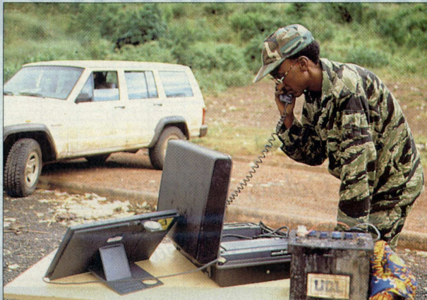
Paul Kagame, commandant du FPR